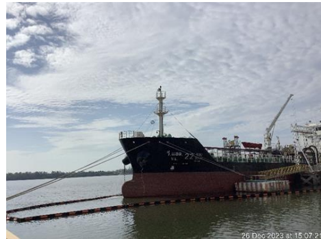
ภาพที่ 8 การล่อมทุ่นดักน้ำมันล้อมรอบเรือ