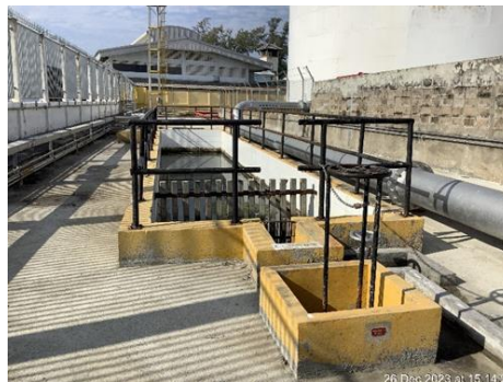
ภาพที่ 9 บ่อดักคราบน้ำมัน Oil interceptor เพื่อทำการแยกน้ำมันออกจากน้ำก่อนระบายสู่ลำรางสาธารณะ