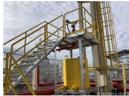
ภาพที่ 4 อุปกรณ์ดับเพลิงบริเวณหน้าท่า