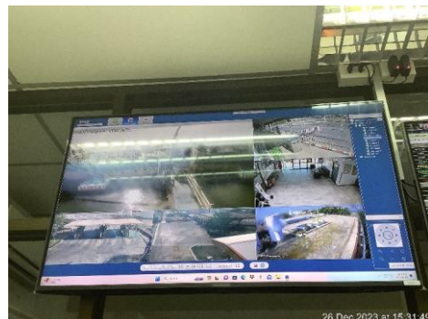
ภาพที่ 10 ป้ายเตือนบริเวณติดตั้งกล้องวงจรปิด (CCTV) และระบบอุปกรณ์กล้องวงจรปิด (CCTV)