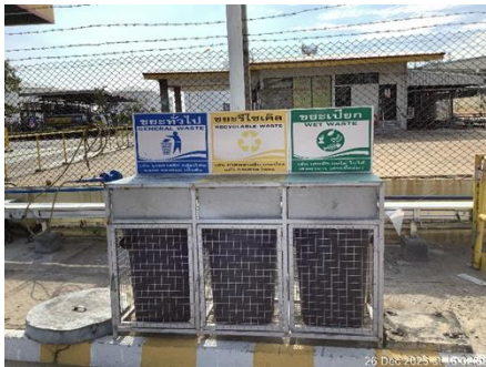
ภาพที่ 1 บริเวณจัดเก็บขยะแยกประเภท