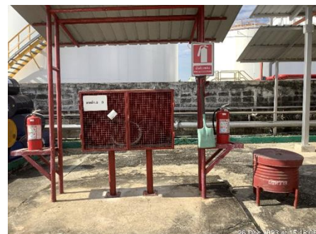
ภาพที่ 5 อุปกรณ์ดับเพลิงภายในคลัง