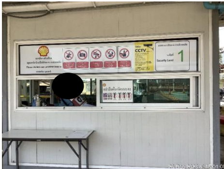
ภาพที่ 7 พนักงานรักษาความปลอดภัย