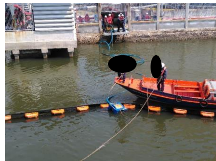
ภาพที่ 11 ภาพกิจกรรมการซ่อมเก็บกู้คราบน้ำมันทางเรือ พ.ศ. 2566